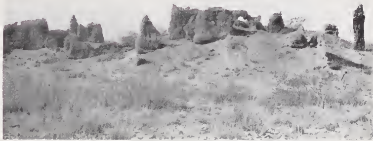
1. — RUINAS DE CASAS GRANDES

Habitáronlo, en un tiempo que no es posible establecer, ó pasaron por él, para seguir al Sur gentes de una cultura notablemente superior á todas las que los españoles hallaron allí después. Dejaron como huellas de su estancia, las soberbias construcciones del Valle de las Cuevas y las de Casas Grandes (Distrito de Galeana) descritas estas últimas por Clavijero y por muchos de nuestros historiadores nacionales, y más tarde, por sabios extranjeros como Russell Bartlett, Bandelier y Lumbholtz. Algunos suponen á esas tribus afines ó parientes de los « Mounds-Builders » ó de los « Cliff-Dwellers » de Nuevo México y Arizona; otros (Clavijero entre ellos) los creen aztecas, y dicen que precisamente, en su larga peregrinación, Casas Grandes fué el asiento de su tercer morada. El primer español que pisó Chihuahua fué Alvaro Nuñez Cabeza de Vaca, quien, desde la Bahía del Espíritu Santo, llegó al Bravo, y entrándose por la cuenca del Conchos (1528), remontó la Sierra Madre, pasando á Sonora, por un cerro que aun guarda su nombre