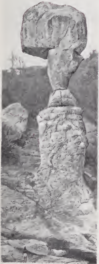
8. — PILAR DE ARENISCA FORMADO POR LA EROSIÓN

Nada da idea más cabal, ni completa mejor la descripción del texto, que el grabado adjunto. Aquí se tiene el aspecto de esas llanuras del Oriente, sin vegetación y en las que los pozos y agujeros son tan raros, que los autores antiguos (Escudero, García Conde) tenían especial cuidado de señalar su ubicación y sus condiciones, para uso del viajero. Del origen probable de esas llanuras, en las que Humboldt encontraba ya algunos caracteres de las mesclas del Asia Central, se habla someramente en el texto, al tratarse de la Orografía.