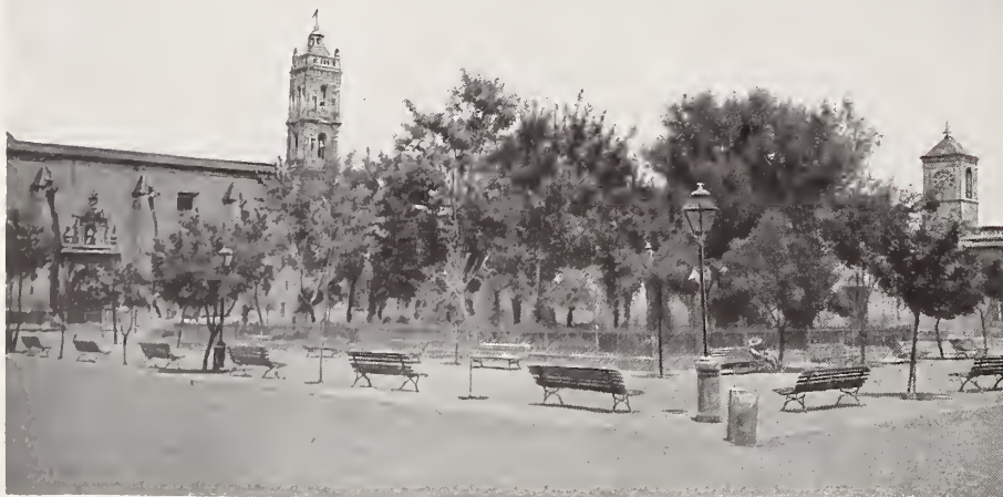
20. — PLAZA DE PARRAL

Ciudad Juárez , á orillas del Bravo; sus principales edificios son : La Aduana, la Administración de Correos, las estaciones del Ferrocarril Centra