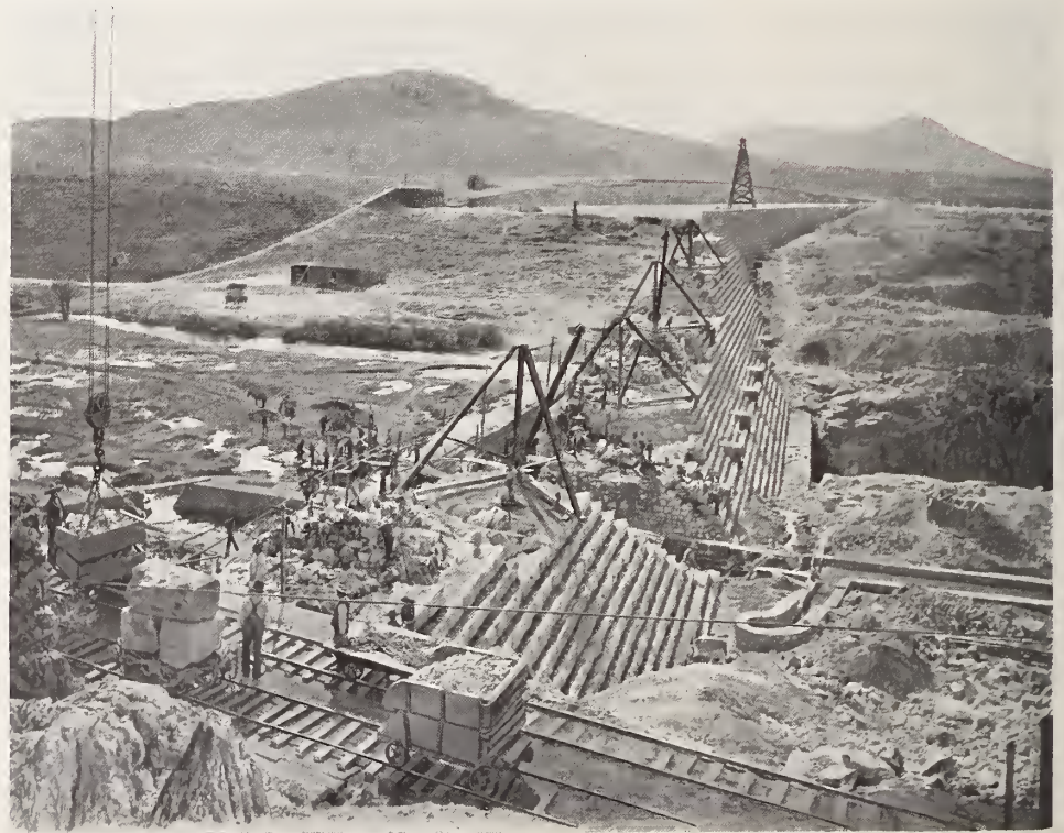
6. — PRESA DE CHUVISCAR

Extremoso, también, es el clima de la región oriental y las diferencias de temperatura, en un mismo punto, son grandes no sólo de estación á estación sino entre el día y la noche. En realidad esas depresiones, recorridas en otro tiempo libremente por los apaches (sobre todo de las familias llamadas llaneros y lipanes) y de cuya aridez nos dan idea los desconsoladores relatos de los ingenieros que después del 48 y del 53, fueron á fijar nuestros límites, ó más tarde á visitar la línea divisoria, ó á deslindar baldíos, son un desierto. El hombre, sin embargo, obra prodigios. No eran más risueñas, comarcas del Colorado, de Arizona, de Nuevo México, de la Alta California, convertidas, por el trabajo perseverante, en sitios habitables y hasta hermosos. Hay que esperar pues mucho del progreso. Hasta ahora siempre, el clima, la sequedad extraordinaria de la atmósfera y del suelo jaguajes y pozos, de agua salada muchas