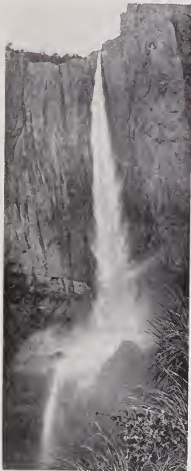
12. — EL SALTO DE BASASÉACHIC

Sinaloa el nombre del Fuerte. Está formado por tres grandes arroyos : el Verde que nace en los límites de Chihuahua y Durango; el Tumáchic ó Chinatú, originado por algunos manantiales situados á corta distancia de los afluentes del Verde, y el Guadalupe y Calvo. Constituido así, el San Miguel corre de Sudeste á Noroeste, pasando por Agua Nueva, Capulín, San Miguel, San Ignacio, Tubares y Realito. Por la derecha recibe al Urique engrosado con el Batopilas. Más al Norte, en la Sierra del Durazno, nace el río de Oteros que pasa por Batopilas y después de 135 kilómetros de curso, en Chihuahua, se interna en Sonora en donde, para entrar en Sinaloa y confluir al San Miguel, forma una curva muy pronunciada con la convexidad al Noroeste.