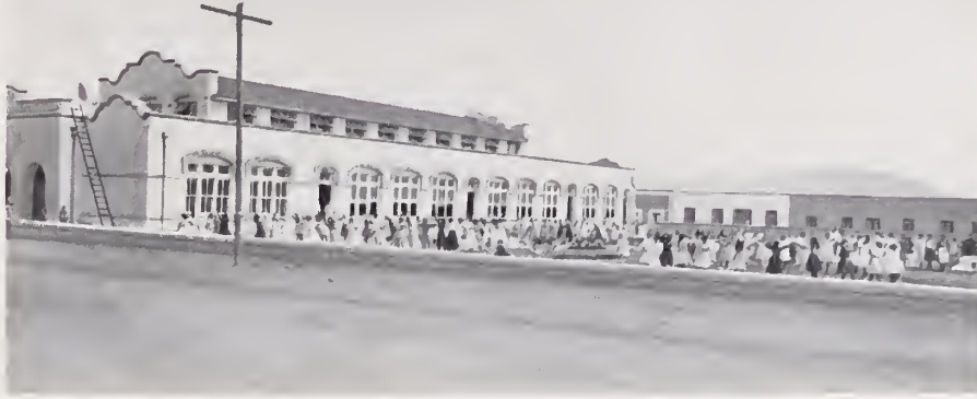
21. — UNA ESCUELA EN CHIHUAHUA

Casi todos los Estados de la República han comprendido la importancia de la educación, y secundando por su parte, las tendencias del Gobierno Federal (en el Distrito y Territorios), dedican una buena parte de sus rentas y todos sus esfuerzos á mejorar sus escuelas — primarias sobre todo — y á implantar otras nuevas. Chihuahua destina casi la mitad de su presupuesto (más de $ 500.000.00 cts) á la enseñanza. Tipo de una de sus escuelas elementales, es la del grabado. (Es la Escuela Modelo 141.)