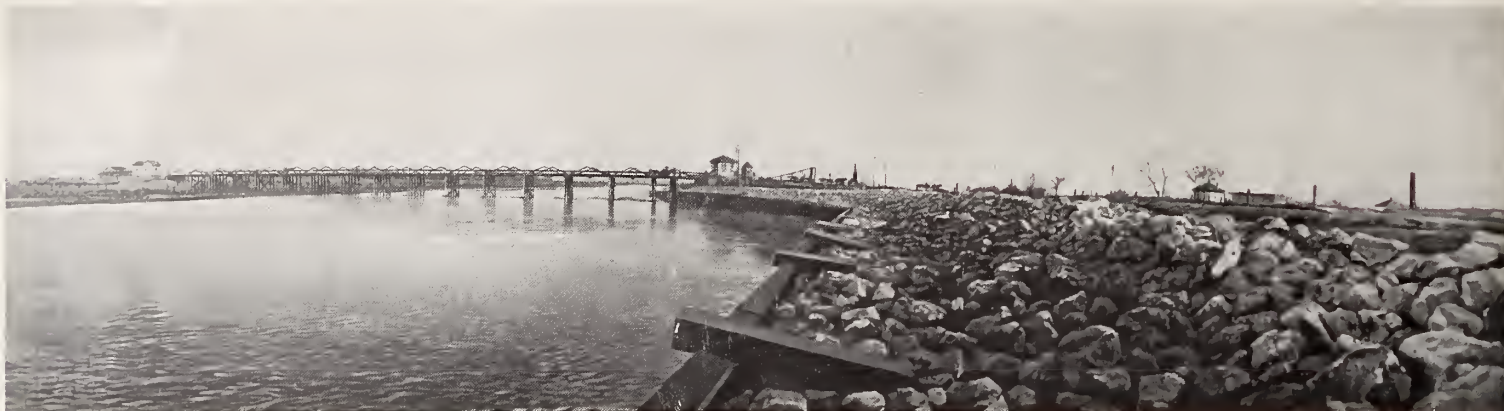
37. — PUENTE DE STANTON

El « Chihuahua al Pacífico » liga la ciudad capital del Estado