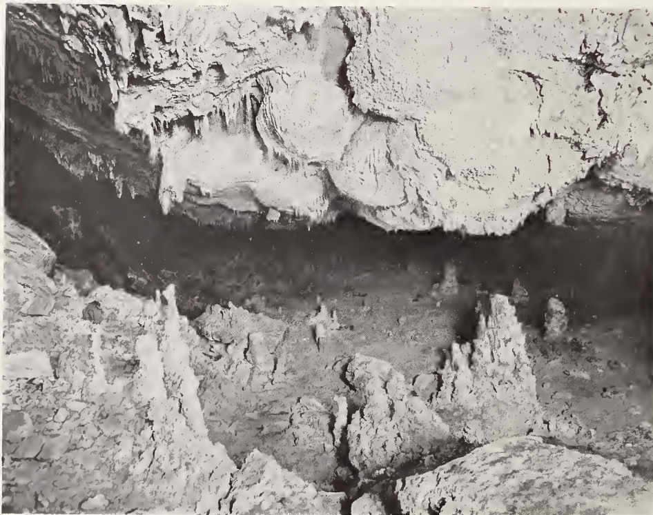
11. — GRUTA DE COYAME

En la orografía de Chihuahua, hállanse cumbres (como las de Jesús María, Tabacotes y La Cruz), mesetas altas, tales como las de los Apaches á que se refiere el texto y la cenagosa de San Miguel (no el San Miguel de que habla Hovey en su división de la Sierra, sino otro, al Sur en Batopilas), y en las cadenas, tanto la principal (Sierra Madre) como sus derivadas, formaciones geológicas dignas de estudio y que revisten formas caprichosas. Tal ésta á que el texto hace referencia, en la barranca de Urique.