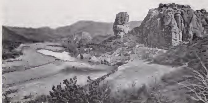
13. — MÁRGENES DEL NONOAVA

Forma la tercera el río del Carmen, que nace en la Sierra del