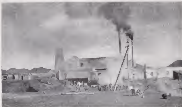
28. — FUNDICIÓN DE RÍO TINTO MEXICANO

La cantidad en que el fisco avalúa las fincas rústicas es de $ 8.171.318. Se emplean en las faenas agrícolas como unos