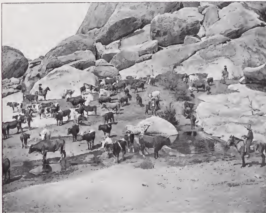
33. — HACIENDA DE CORRALES, EN EL DISTRITO DE JIMÉNEZ

Las colonias mormonas están establecidas en el Norte del Estado con varios nombres (Juárez, Díaz, Pacheco, Dublán, etc.). Han prosperado notablemente. Como los colonos no pagan impuestos de ninguna clase por los artículos que consumen ó importan (todos de los Estados Unidos) ni por los que exportan (al mismo país) ni por sus semovientes, industrias, etc., piensan algunos que ningún bien reportan al Estado; pero además, de que los privilegios de que disfrutan no han de durar siempre, los mormones han abierto tierras vírgenes, hecho caminos, instalado teléfonos, y son, sobre todo, una lección viva de lo que pueden la perseverancia y el trabajo. La poligamia que los hizo antipáticos á