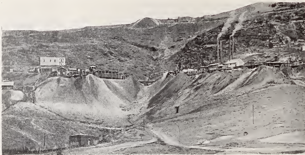
23. — LA VETA COLORADA EN PARRAL

hallada — dice el mismo Lejeune — fuera de la línea de metalización del lugar, y su descubrimiento no ha sido sino un incidente feliz y un episodio brillante en la historia del Parral ». De ella, y de las otras minas en trabajo en Parral (« El Tajo », « La Prieta », « Jesús María », « Cabadeña », « Quebradilla »,