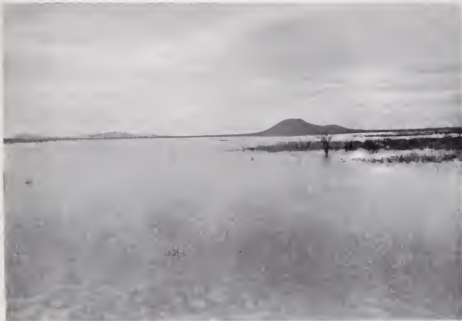
29. — PRESA DEL HUÉRFANO

En la estación Terrazas del Ferrocarril « Río Grande, Sierra Madre y Pacífico », situada al Sur de Casas Grandes (Distrito de Galeana), se encuentra el importante mineral y la fundición de Río Tinto Mexicano. En las « Minas de Chihuahua » de Griggs se asegura que en el año anterior, de 1907, el valor de los metales tratados en esa fundición ascendió a $ 176 887.00.