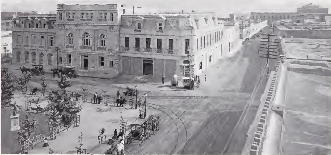
18. — VISTA DE CHIHUAHUA

Chihuahua. — Capital de Estado situada á los 28° 38' 23" de latitud Norte y á los 6° 56' 22" de longitud Oeste del meridiano de México (Valle y Fernández) y á 1.516 de altura sobre el nivel del mar, en las márgenes del río de Chuviscar, en un valle muy amplio abierto en el sentido de la corriente. El caserío de la ciudad tiene por asiento las ondulaciones que forman los cerros Grande, Santa Rosa y Coronel, los cuales la dominan. Chihuahua es una ciudad industrial, de extraordinaria actividad y de gran porvenir; sus calles son rectas, amplias.