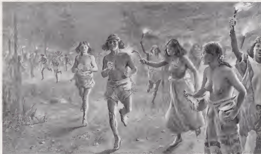
16. — TARAHUMARES CORRIENDO CON ANTORCHAS

En cuanto á su idioma, del que se derivan muchos nombres geográficos de Chihuahua (Bocoyna — « pino que gotea » — Yoquivo — « abejarruco de la mesa » — Temósachic — « montón de piedras ó donde hay piedras » — Tosánachic — « donde hay blanco ») ha servido para formar una gran familia filológica — la « ópata — tarahumar — pima », de Orozco y Berra, ó la sonorensis — ópata-pima, de Pimentel.