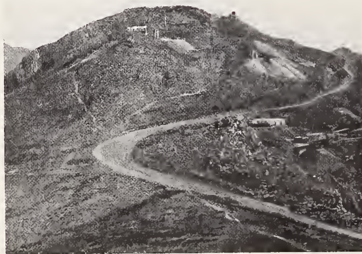
24. — LA PALMILLA

La gran veta en la que se hallan la mayor parte de las minas del Parral corre de Sur á Norte. Se dice que fué descubierta en 1600 por un minero de Santa Bárbara. Se le ha reconocido en una longitud de 16 kilómetros. Tiene una inclinación, sobre la horizontal, de 52 grados. La más grande profundidad alcanzada en ella es la de 500 metros sobre el filón, ó 300 metros en línea perpendicular. « La capa, dice Lejeune, de escurrimiento hidrotermal que ha acarreado á ella la plata, se ha ramificado en corrientes, más ó menos pronunciadas y ha formado streaks, paralelos, zonas más ó menos ricas, separadas por zonas estériles, caballetes ó caballos. » Una de esas zonas de escurrimiento argentífero de 3 á 30 metros costea el muro y se le explota en Quebradillas.