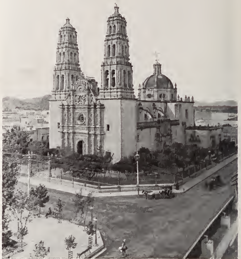
19. — CATEDRAL DE CHIHUAHUA