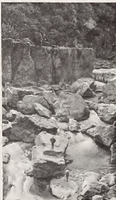
32. — SALTO EN SAN NICOLÁS DE LA JOYA

En un cañón inmediato á este pueblo surcado por ríos que van á unirse al Conchos. Se han hecho estudios muy pormenorizados para construir una presa que podría almacenar más de mil millones de metros cúbicos de agua. Como hay cerca, minas, haciendas de beneficio y terrenos susceptibles de riego, la obra sería altamente provechosa á la región. El humilde caserío de la vista desaparecería al hacerse la obra.