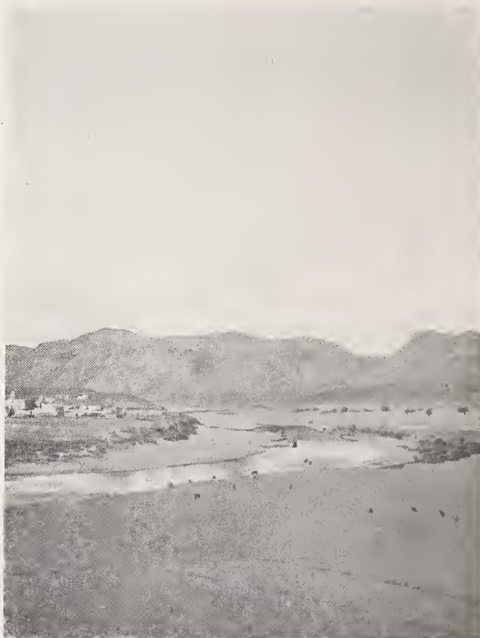
31. — SAN NICOLÁS DE LA JOYA (VILLA ESCOBEDO)

hacer uso, se inserta la siguiente lista de los ríos y arroyos federales: