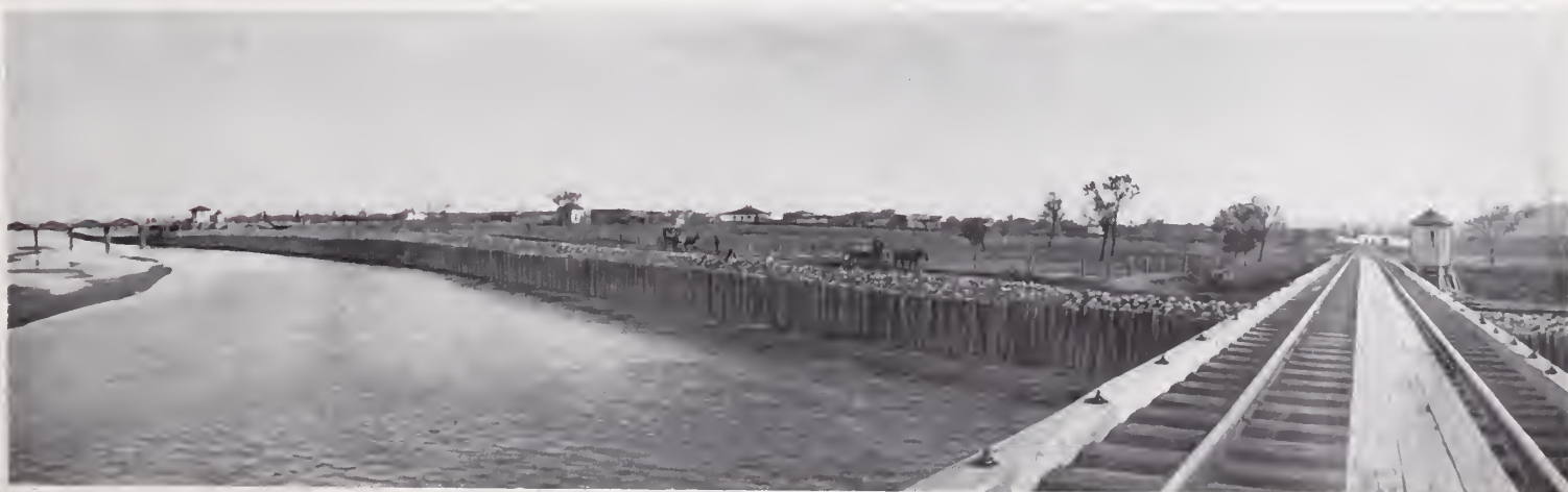
36. — PUENTE DEL « RÍO GRANDE, SIERRA MADRE Y PACÍFICO »

Este ferrocarril que terminado facilitará la explotación de centros mineros de primer orden, y que ahora sólo llega á un sitio llamado Mesa de Sandia (Durango), es también de los más pintorescos del país. En el grabado pueden verse — á la derecha — las rocas desgastadas por la erosión, que en todas partes (así en la Sierra como en el desierto), se hallan, como rasgos genuinos del aspecto de Chihuahua.