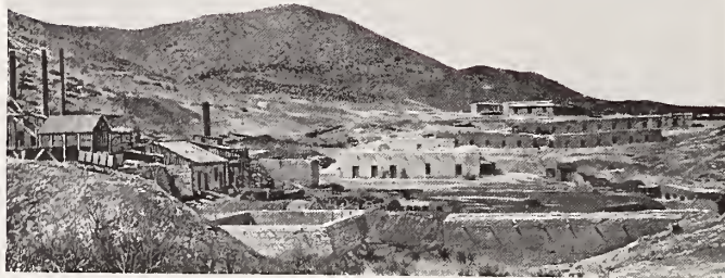
27. — FUNDICIÓN DE « EL MAGISTRAL »

Esta mina, una de las más ricas del célebre mineral de Santa Eulalia (productos en 1906; según el libro de Griggs, $ 8.510.467), es notable además porque, al revés de lo que sucede en los otros criaderos del yacimiento á que pertenece, el zinc — como dice Lejeune — « tiene allí su dominio especial ». Y es digno todavía de atención el hecho de que se le halle « á solo 500 metros de la bonanza de plomo de Buena Tierra », otra mina por la que una compañía californiana pagó, haciendo un espléndido negocio, $ 375.000. (En ella se encontraron bajo una masa de carbonatos de plomo (cerusita) riquísimos sulfuros de plata de $ 8.000 por tonelada, plata verde y plata nativa.) El Potosi está perfectamente trabajada y unida con Santa Eulalia y Chihuahua por ferrocarriles.