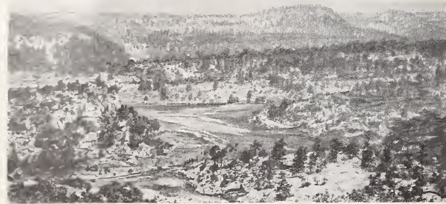
5. — LA SIERRA EN HUMARISA. (AL SUR DE GUACHOCHIC, CUYA UBICACIÓN SE FIJÓ YA.)

profesores Hill y Hovey, opinión en parte seguida por el distinguido geólogo Sr. Aguilera, sobre una base de caliza cretácea, que debió elevarse como á 1.800 metros sobre el nivel del mar, y que constituyó el relieve primitivo, acumuláronse rocas efusivas : andesitas, en toda la zona ; rhyolitas, desde el paralelo 20° hacia el Norte, y basaltos, en extensiones menos considerables en esta