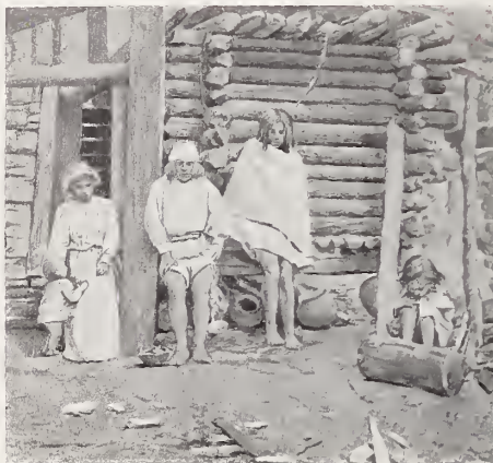
17. — FAMILIA TEPEHUANA

El poder Legislativo se ejerce en Chihuahua por el Congreso; el Ejecutivo por el Gobernador del Estado, y el Judicial por el Tribunal Superior y los Jueces de 1ª Instancia, Menores y de Paz que residen en la capital y en las cabeceras de los Distritos