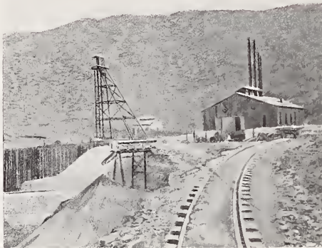
26. — MINA DE « EL POTOSI » (SANTA EULALIA)

París y Londres, comenzó á funcionar en pequeño; fué aumentando su capacidad, y aun pensaron los accionistas, dueños de ella, construir otras en Torreón y en Chihuahua. Es de mencionarse también la fundición de « Río Tinto Mexicano » en la estación Terrazas del ferrocarril « Río Grande, Sierra Madre y Pacífico », en un mineral rico en cobre.