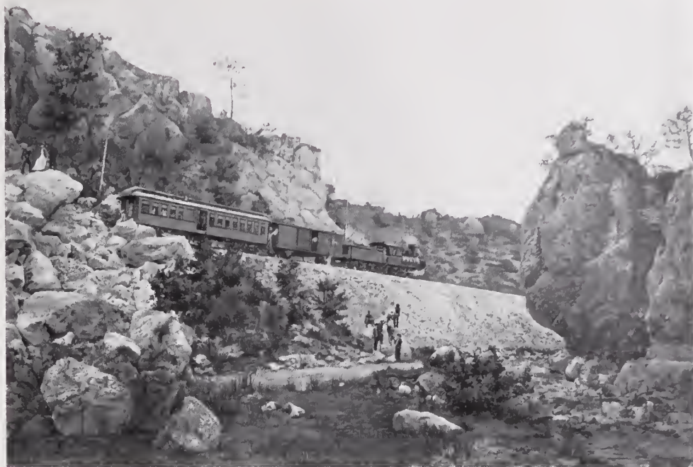
35. — PAISAJE EN EL CAMINO DEL PARRAL A DURANGO

La línea troncal del Ferrocarril Central Mexicano recorre el Estado, de Norte á Sur, en una extensión de 715 kilómetros contados desde Ciudad Juárez hasta los límites con Durango: cruza