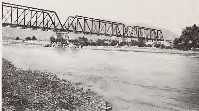
34. — PUENTE DEL FERROCARRIL CENTRAL

el cordón del Paso y Nuevo México. Estos vienen todos los años á la villa de Chihuahua, en número de doscientos ó trescientos hombres. Traen aguardiente, vino, sal, frazadas, colchas, gamuzas, pasas y otros comestibles en cantidad con cuyo importe compran lo que necesitan, unos para comerciar con ellos y otros para sus casas y familias solamente ». El comercio estuvo, en general, durante el siglo XVIII y principios del XIX, monopolizado en muy pocos, y todo efecto, aun los de primera necesidad, no se obtenía sino á precios fabulosos (Escudero). Hasta 1834, Chihuahua compraba á Michoacán, Jalisco, Guanajuato y Nuevo León: dulce (piloncillo ó panocha), azúcar, arroz, cacao, pieles curtidas y objetos de alfarería; á México y Puebla, telas y calzados; é importaba de Europa y los Estados Unidos, por las vías de México, Matamoros, Guaymas y Nuevo México, paños finos, tejidos de lino, sedas, etc. Vendía en cambio, su oro, plata y cobre; su trigo y maíz; alguna fruta; ganado, y como artículos de su industria, « sus vinos y licores de El Paso » y algunas pieles y tejidos burdos de lana que mandaba á Sonora. En 1842, decía García Conde, que el dinero circulante en Chihuahua no podía apreciarse en más de $ 300.000, pues que, exceptuándose en las principales poblaciones, en las demás el comercio se