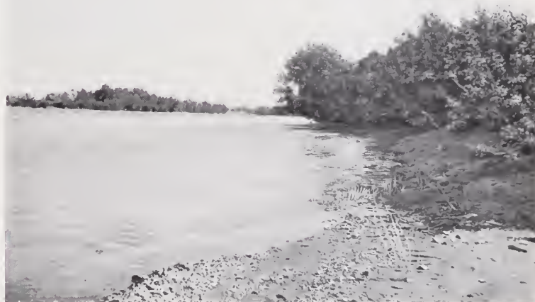
14. — UNA VISTA DEL CONCHOS

La vertiente oriental consta de una sola cuenca : la del Conchos. Este río, esencialmente chihuahuense, pues que con excepción de uno de sus tributarios principales, el Florido, y otro