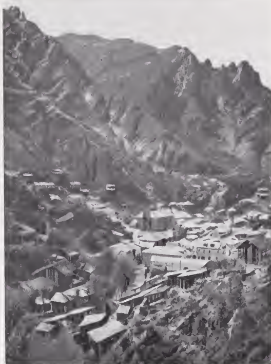
22. — OCAMPO (ANTES JESÚS MARÍA)

plata) la particularidad de ofrecer, con muy altas leyes, « pocas habrá en el mundo, decía Gamboa, que superen á estas », y Dana menciona una muestra de mineral de Batopilas que produjo 200 libras de plata, gran dificultad para su extracción y beneficio, por la dureza de la roca en que arman. Son estos filones de los típicos de rocas eruptivas. Sus vetas que van de Sur á Norte