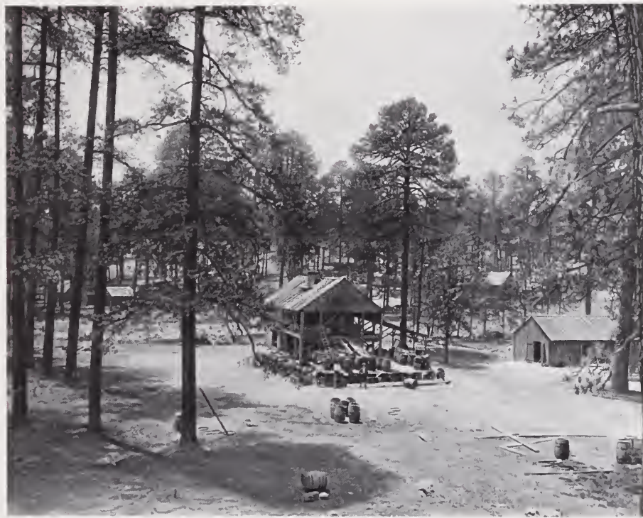
4. — RANCHO EN « MADERA »

La copia de la fotografía muestra el aspecto de una de esas mesetas, muchas de ellas cenagosas, y cuyas filtraciones alimentan los ríos, que se hallan en la cadena madre. Se ve aquí un grupo de árboles, pero todavía no es esta la selva opulenta que ocupa Distritos enteros de la Sierra de Chihuahua.