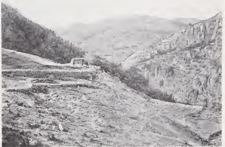
9. — BARRANCA DEL COBRE

adelante los geógrafos de Chihuahua — de Este á Oeste, de tal modo, « que las montañas más elevadas de Sonora tienen sus cimas al nivel de los valles que se abren entre Cusihuiriachic y Cerro Prieto ». Las eminencias que dominan son: Cerro Prieto á 2.124 metros, la