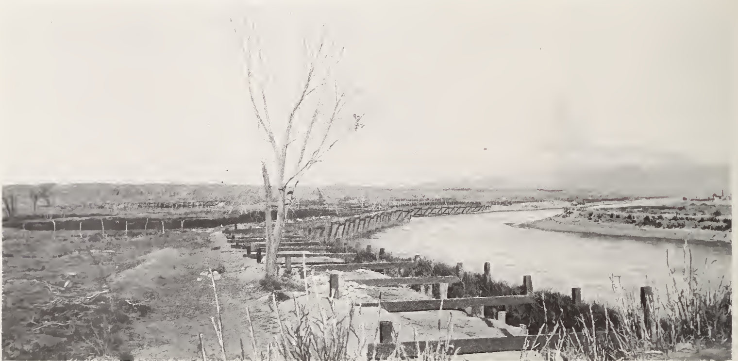
15. — EL BRAVO, FRENTE Á CIUDAD JUÁREZ

La cuenca hidrográfica del Conchos, por lo que ha podido verse por la longitud de algunos de sus tributarios, y como se nota consultando la carta adjunta, es muy extensa. No se fija una cifra, ni siquiera aproximada, por no haberse encontrado datos precisos para hacerlo. Muchos de los arroyos que forman