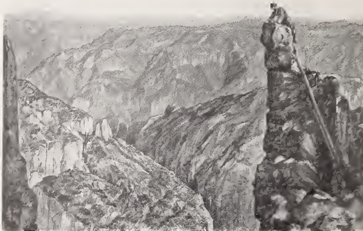
10. — ROCAS EN LA BARRANCA DE URIQUE

2ª La del río de San Miguel ó de Güerachic, que toma en