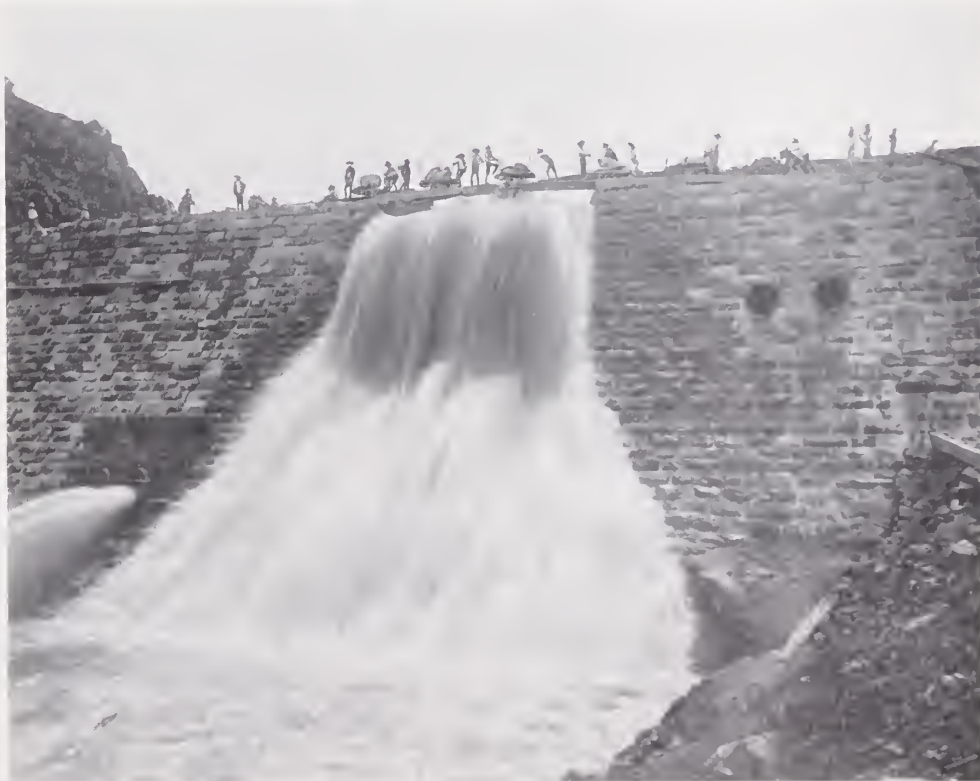
30. — PRESA DE TALAMANTES SALAICES

Riquísimo en maderas, como se ha visto ya, es el Estado. Se les explota en grande escala, y como la explotación se hace en proporciones cada vez más vastas, sin que se procure reponer los árboles caídos, por más que en muchos lugares la selva se repueble por si sola (Lumholtz vió extensos espacios cubiertos por los brotes ó renuevos de los pinos), la tala sin medida acabará por agotarla (El Gobierno Federal cuida hasta donde es posible de que esto no suceda por medio de su Agente de