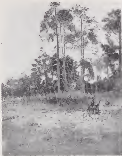
3. — MESETA EN LA SIERRA

el relieve de su suelo — valles altos cortados por serranías de débil altura generalmente — se dijo que la surcan el Conchos y sus numerosos afluentes y sub-afluentes. Compréndese, pues, que es la mejor regada de las tres y por consiguiente la más rica.