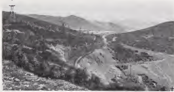
25. — VISTA GENERAL DE SANTA EULALIA

El mismo autor describe así en conjunto el mineral : « A 16 kilómetros al Sureste de Chihuahua se eleva, á 500 metros sobre la llanura, una de esas cadenas aisladas, esparcidas sobre toda la alta meseta mexicana. . . . Es desnuda y árida, y cortada por erosiones profundas, cañones, ahuecados por las aguas torrenciales. Tiene 12 kilómetros de largo y 8 de ancho. A primera vista se le creería una masa compacta de pórfido, ó más bien de rhyolita porfídica. . . . Exteriormente está negrecida por óxidos de hierro y manganeso, que dan á las pendientes, á los picos, á los flancos de los cañones, su sombrío color. Pero si se sube al « Picacho Oriental », que domina el